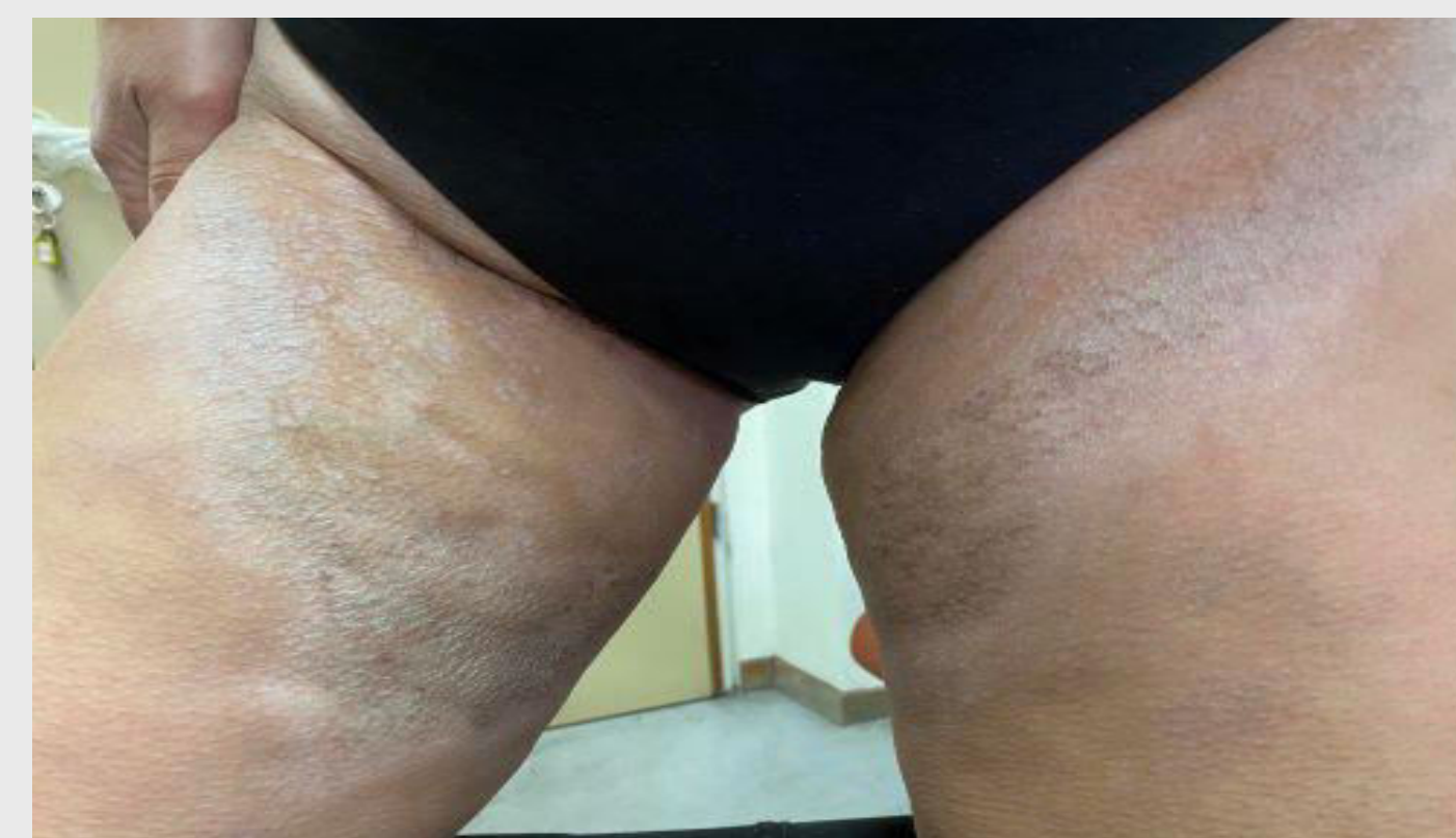
Εικόνα 1: Γραμμοειδής κατανομή κατά μήκος των γραμμών του Blaschko.

Το τρίτο περιστατικό αφορά σε γυναίκα 65 ετών με ιστορικό σκληρού και ατροφικού λειχήνα έξω γεννητικών οργάνων από τριετίας και πρόσφατη έκθυση εξανθήματος αποτελούμενου από σκληρές, ερυθματώδεις πλάκες στην πρόσθια κοιλιακή χώρα και ατροφική υπομελαγχρωματική πλάκα στο δεξιό μαστό.